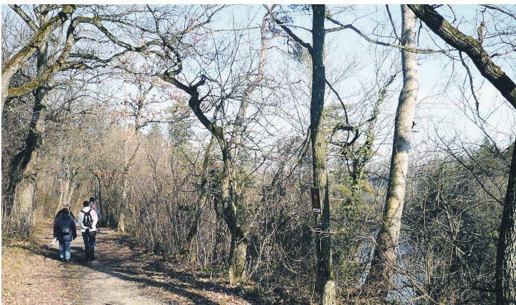
Ybbs-Uferweg durch den Heidewald

Wandertipps zum Downloaden: www.tips.at/service/archiv