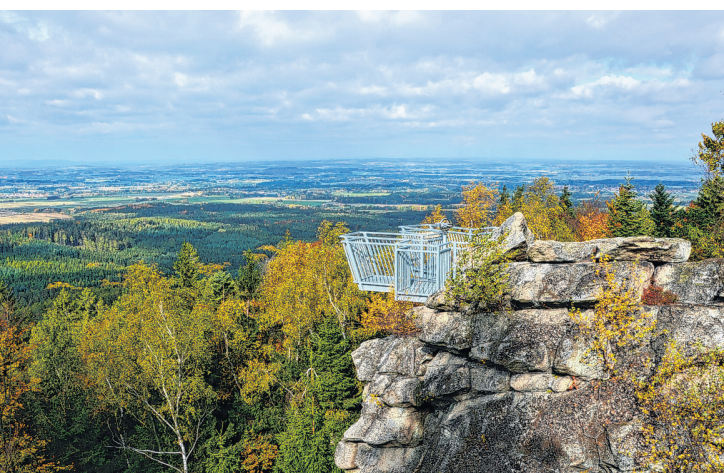
Die Aussichtsplattform am Gipfelplateau des Mandelstein

Der Abstieg folgt der gleichen Route, ist aber nicht weniger spannend, denn jeder von der anderen Richtung begangene Weg sieht anders aus. ■