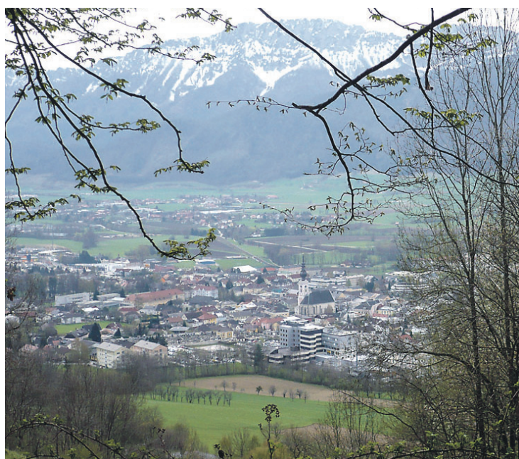
Ausblick von der Scherleiten auf Kirchdorf und Kremsmauer