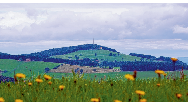
Blick auf den Hegerberg

Feldern. Exakt drei Stunden und dreißig Minuten benötige ich für den Anstieg, so wie in der Wegbeschreibung angegeben, dann bin ich ganz oben am Hegerberg. Das Panorama ist weit und fantastisch, ein echter Genuss. Das Johannenziger Haus hat das ganze Jahr über geöffnet und bietet Speis, Trank und Unterstand an. Mir ist der Trubel etwas zu viel, ich ruhe mich abseits ein wenig aus, bevor ich mich auf den Rückweg mache. Der führt mich die ersten 20 Minuten die gleiche Route zurück, wie beim Hinweg. Dann wende ich mich nach links, folge dem Weitwanderweg 04 beziehungsweise dem regionalen Elsbeerweg. Etwa zehn Minuten später verlasse ich die markierte Route und mache einen Abstecher nach rechts hinunter zum Refugium Kloster Hochstrass, das zu einem modernen Seminarhotel umgebaut wurde. Es ist ein besonders stimmiger Platz, deshalb hat es mich hierher gezogen. Ich mache kurz Rast und genieße die Energie. Beim weiteren Abstieg folge ich nun einfach der asphaltierten Zufahrtsstraße, die mich direkt zurück nach Stössing bringt. ■