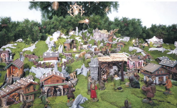
Krippenberg von der beweglichen Gschwandhäusl-Krippe