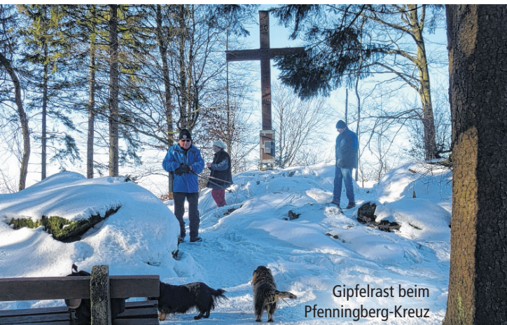
Gipfelrast beim Pfenningberg-Kreuz