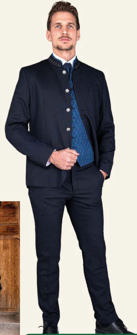
Der neue Oberösterreichischer - Anzug