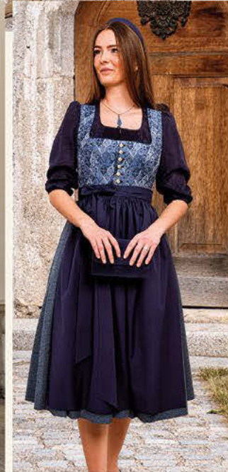
Bodenständig, zeitlos, wertvoll